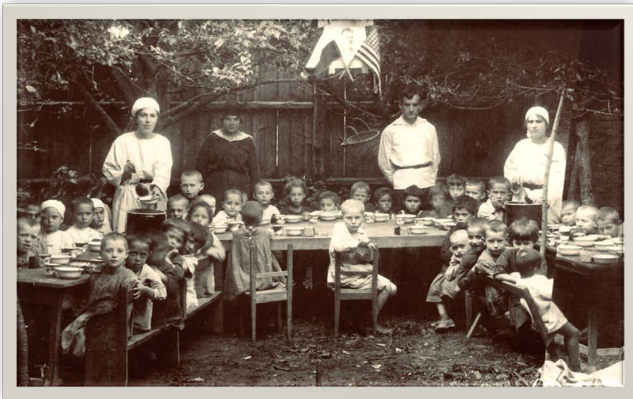
Kuchnia Polsko-Amerykańskiego Komitetu Pomocy Dzieciom (PAKPD) w Równym, 1921 r. Za stołem wisi portret Herberta Hoovera

Amerykańska Administracja Pomocy (American Relief Administration, ARA) działała w Polsce w pierwszych latach II Rzeczypospolitej. Wywodziła się z serii misji humanitarnych w Europie Środkowo-Wschodniej zarządzanej przez Administratora Żywności USA Herberta Hoovera. Misje były częścią programu pomocowego dla Europy zatwierzonego przez Prezydenta Woodrowa Wilsona i sfinansowanego przez Stany Zjednoczone. Miały one na celu udzielenie pomocy gospodarczej i humanitarnej, a także poprawienie warunków społecznych, by tym samym zapobiegać w krajach zachodnich rewolucjom podobnym do tej, jaka miała miejsce w 1917 r. w Rosji.