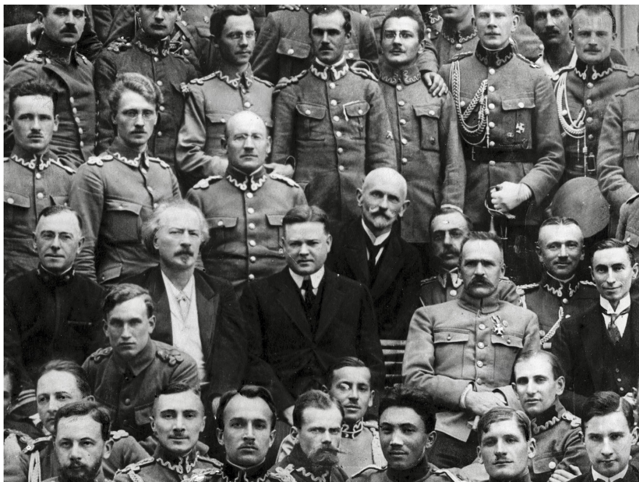
Herbert Hoover obok Ignacego Paderewskiego i Józefa Piłsudskiego na tarasie Belwederu w Warszawie, 13 sierpnia 1919 r.