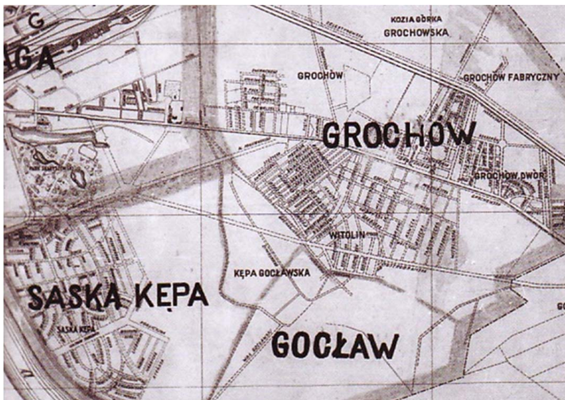
Fragment mapy terenów przyłączonych w 1916 r.