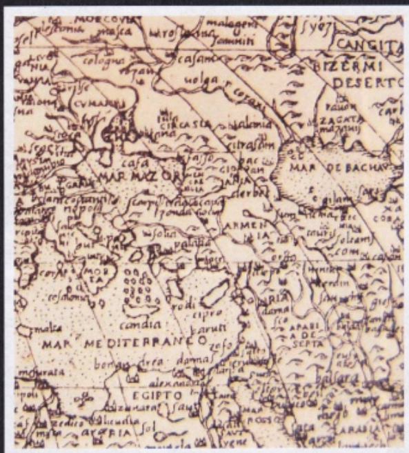
Armenia na mapie świata Gataliego z 1562 roku (fragment).