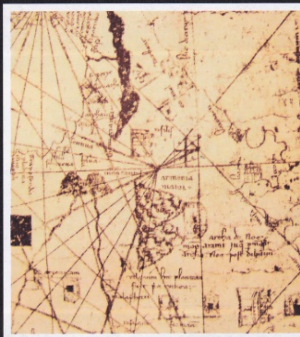
Armenia na mapie świata Angelino Dulgera z 1339 roku (fragment).