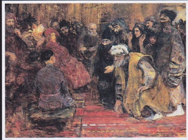
Teodor Axentowicz „Ormanian w króla Jana Kazimierza”.