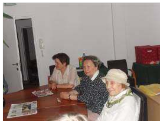
Zdjęcia z obrad Komisji Historycznej Towarzystwa Przyjaciół Warszawy przy okrągłym stole.