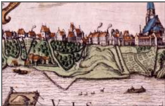
Widok Warszawy (...) po 1586. Rycina z dzieła G. Brauna, F. Hogenberga.