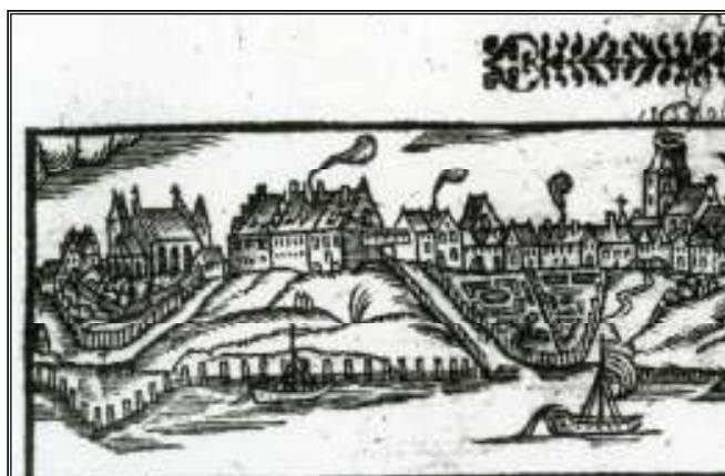
Zamek Królewski od strony Wisły w XVI w. Na brzegu widoczne umocnienia z dębowych pali.